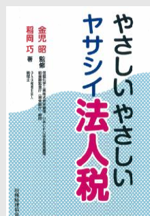
OAG税理士法人 税理士 稲岡巧 著

ただ今、テスト稼動支援サービスのお見積りをご依頼いただいた方全員に、こちらの本をプレゼントさせていただきます。