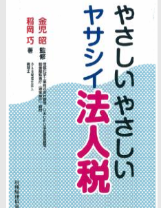
OAG税理士法人 税理士 稲岡巧 著

ただ今、テスト稼働支援サービスのお見積りをご依頼いただいた方全員に、こちらの本をプレゼントさせていただきます。